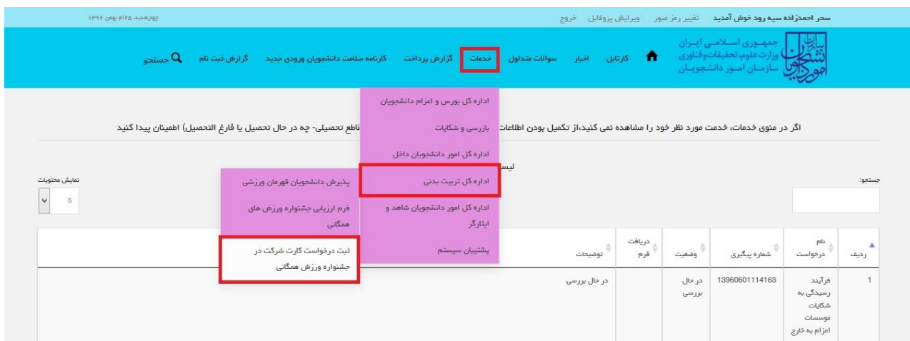
تصویر ۱- نمایش پورتال

توجه بفرمایید که متقاضی برای مشاهده این درخواست در منوی خدمات، باید حداقل یک مقطع تحصیلی کاردانی به بالای داخل کشور با وضعیت تحصیلی شاغل به تحصیل در پروفایل خود داشته باشد.