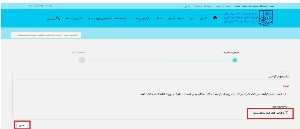
تصویر ۲- موافقت با قوانین گفته شده

قوانین را خوانده و "با قوانین گفته شده موافق هستم" را انتخاب نمایید سپس با کلیک بر روی دکمه بعدی، فرم ثبت درخواست کارت شرکت در جشنواره ورزش همگانی به شما نمایش داده می شود. (تصویر ۲)