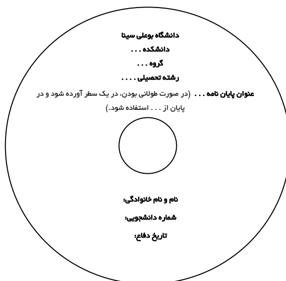
شکل ۱. مشخصات لوح فشرده (cd) تحویلی

تبصره ۳: لوح فشرده از رنگ روشن انتخاب و روی آن با مائیک مخصوص مشخصات مطابق شکل زیر، درج شده باشد.